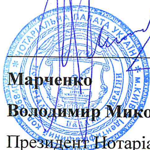
Марченко Володимир Миколайович Президент Нотаріальної палати України