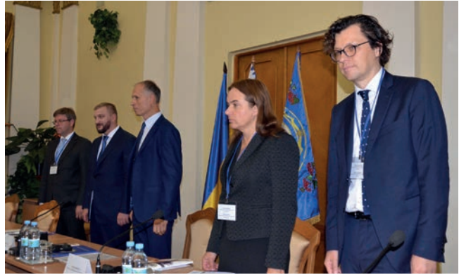
Нотаріат у фокусі