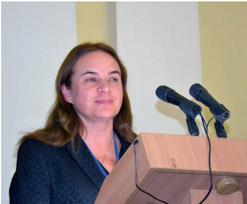
Милда Вайнюте, министр юстиции Литовской республики

Уважаемые нотариусы, участники и гости конференции, в первую очередь хочу отметить, что нотариат Литвы уже несколько лет поддерживает тесные связи с Нотариальной палатой Украины. Надеемся, что это сотрудничество продлится и впредь.